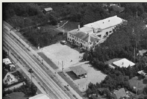
Greve Badehotel i hhv. 1926 (tv.) og 1937 (th.).