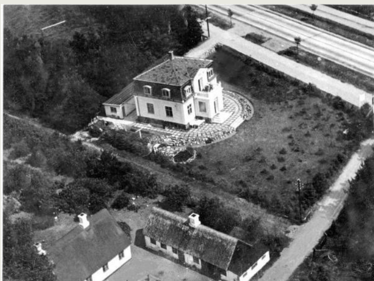
Billedet fra 1940'erne viser den oprindelige tilkørsel til huset.