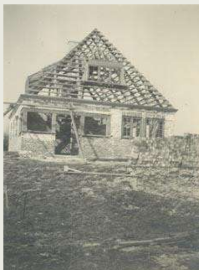
Tv. 1920'erne th. 1918