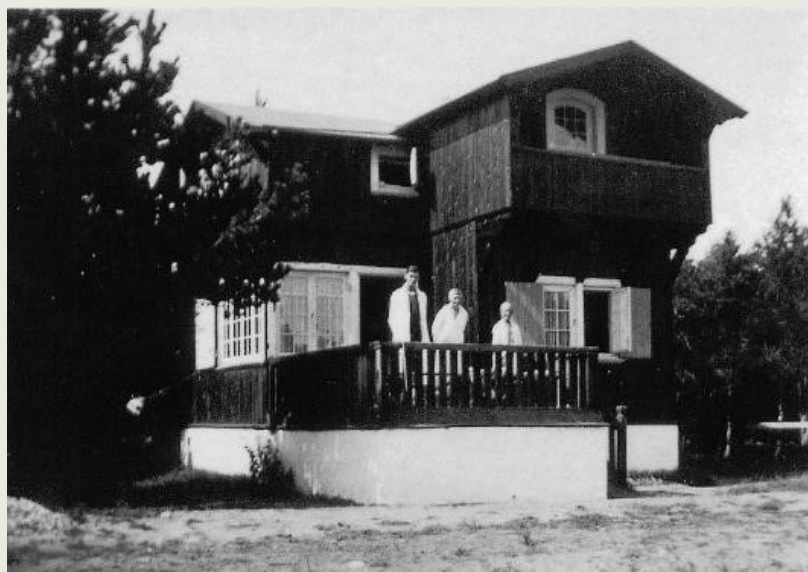
Huset i hhv. 1920 (tv.) og 1930'erne (th.).