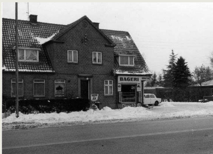
Købmandsforretningen i 1960'erne.