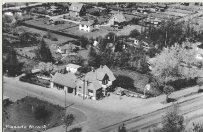
Greve Strandvej 154 i 1940'erne