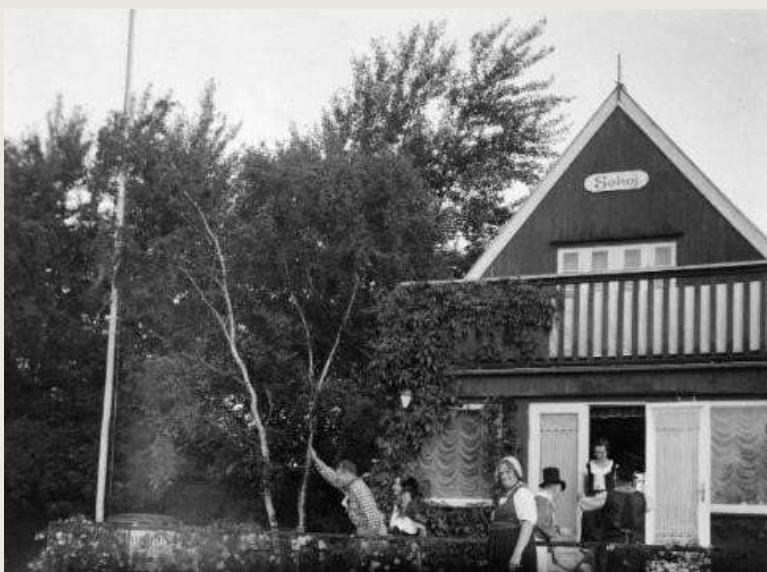
Huset, som det så ud i 1930'erne.