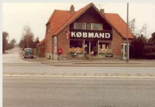
Greve Strandvej 154 i 1970'erne

I 1962 foretages en væsentlig ombygning af facaden mod Strandvejen. Butikken lukker i 1980, hvilket også gør den til en af de længst overlevende købmandsbutikker langs strandvejen efter at centerstrukturen bliver realiseret som et led i Køge Bugt Planen. Bygningen er i dag stadig i brug som butik.