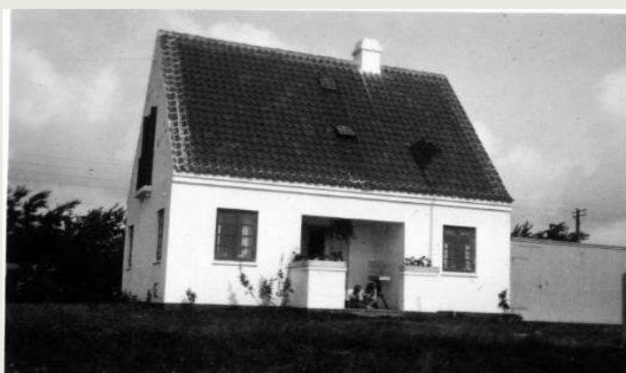
Huset i hhv. 1919 (t.v.) og 1950 (t.h.).