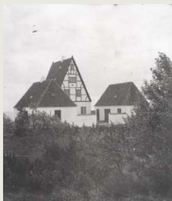
Villa Olsbæk i hhv. 1912 (t.v.) og 1943 (t.h.).