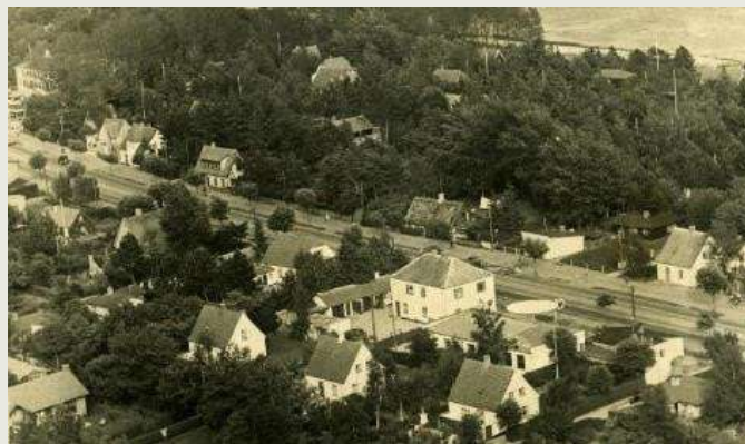
Huset i hhv. 1935 (t.v.) og 1949 (t.h.).