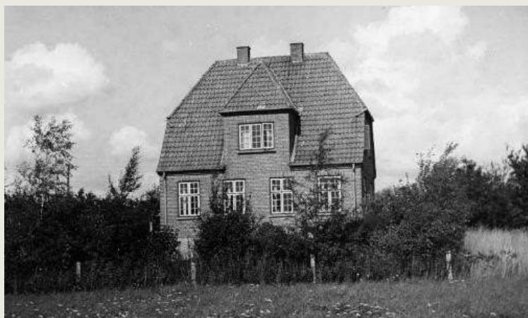
Huset i 1930'erne.

I 1953 opfører justitsministeriet en gammel tyskerbarak på hjørnegrunden ved siden af huset, og fra da af fungerer Dalbo kun som tjenestebolig for politimesteren. Justitsministeriet afhænder boligen i 1990 og i dag fungerer den som privat bolig. Der er foretaget en nyere tilbygning bag på huset.