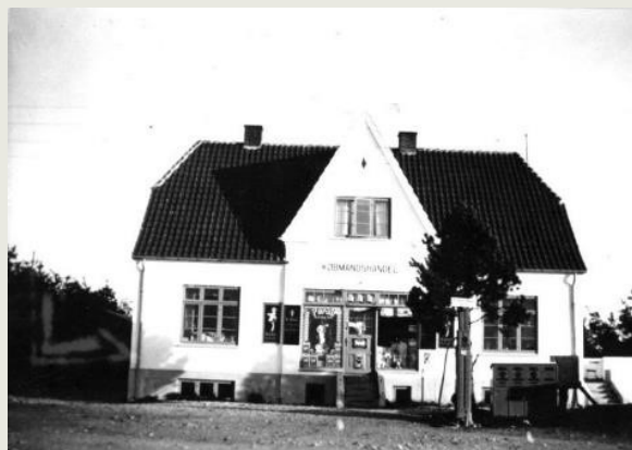
Starten af 1930'erne