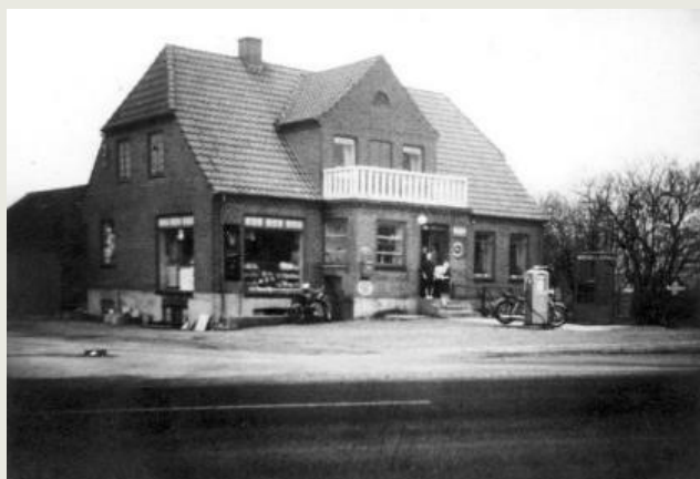
Greve Strandvej 154 i 1940'erne