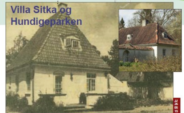
Villa Sitka og Hundigeparken