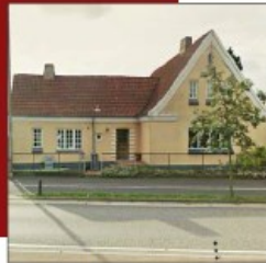
Sommerbo Opført 1912