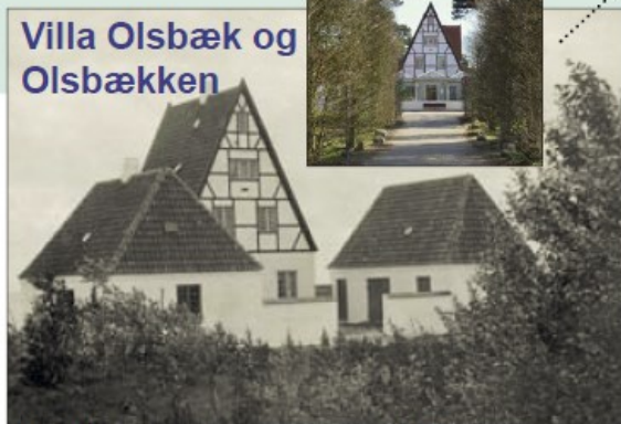
Villa Olsbæk og Olsbækken