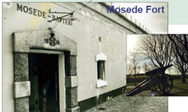
Mosedede Fort med græsplane, opført 1913