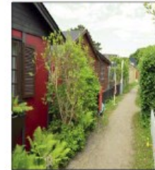
Strandhusene i Greve Opført fra ca. 1972 og frem