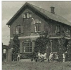
Klinten Opført 1911