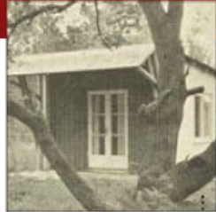
Feriecenter (tidligere) Grundlagt 1929 Nuværende bygninger opført ca. 1970