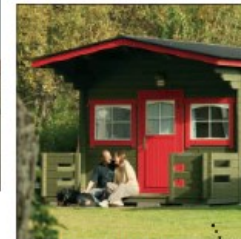
Hundige camping Danmarks første og ældste campingplads fra 1926