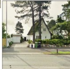
Greve Strandvej 131 Opført 1929