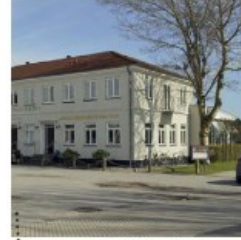
Greve Strandkro Opført 1900