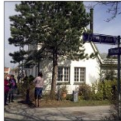
"Antikhuset" Opført 1929