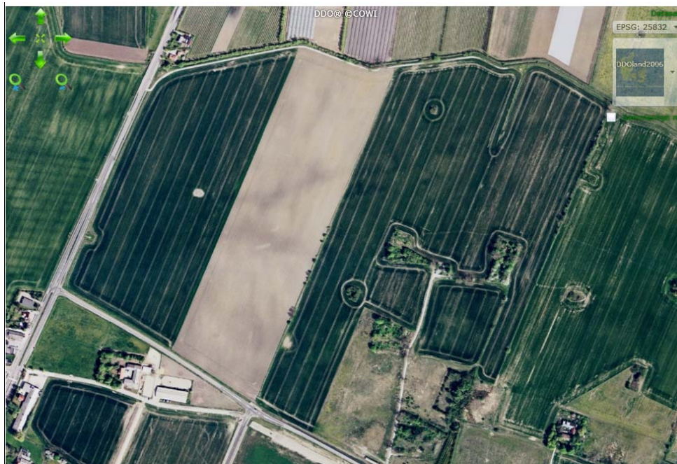
Figur 4: Flybilledet viser Tværhøjgård i 2006 (COWI, 2015).

Området har tidligere været benyttet til landbrug som det fremgår af lokalplanen (jf. 14.38). Det kan derudover ses på Figur 4 at området i 2006 var landbrugsland. Det giver derfor ikke anledning til mistanke om forurenende aktivitet i området.