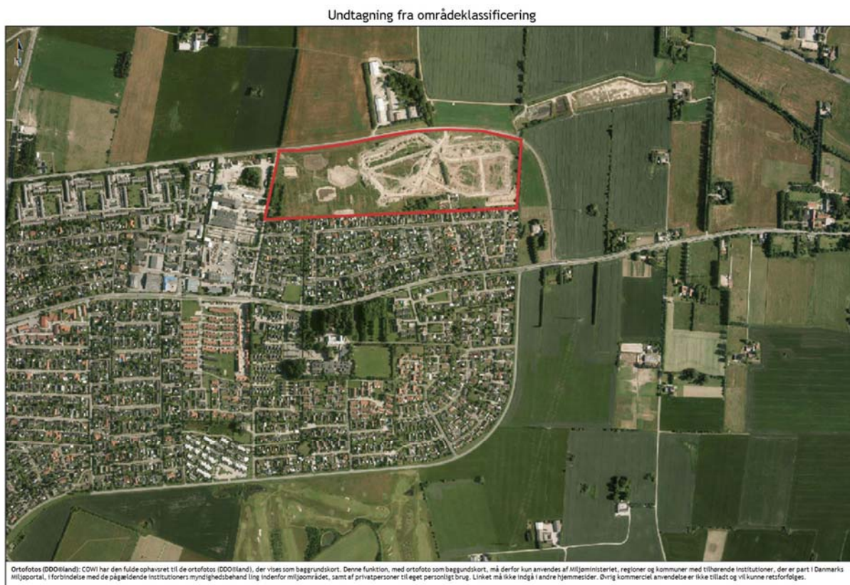
Figur 1: Området der skal undtages fra områdeklassificering (COWI, 2015).

Der er i området ved Tune NØ ikke anledning til mistanke om forurening og derfor ingen grund til indlemmelse i byzonen. Dette giver mulighed for undtagelse af områdeklassificeringen i kraft med at området yderligere opfylder de vejledende kriterier (Miljøministeriet, 2007). Lokalplanen Tune