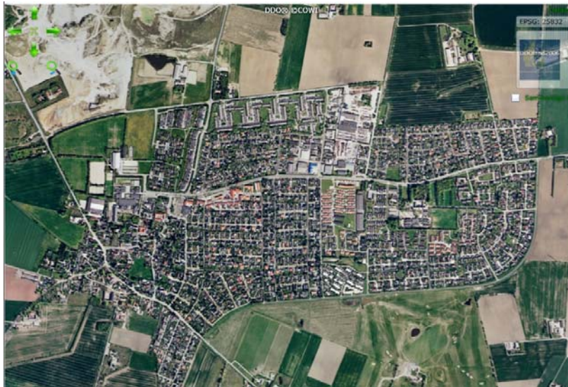
Figur 2: Kortet viser Tune i 2006 (COWI, 2015).

Det kan ses på Figur 2 at området blev benyttet til landbrug i 2006 og der bør derfor ikke være årsag til mistanke om forurenende aktiviteter.