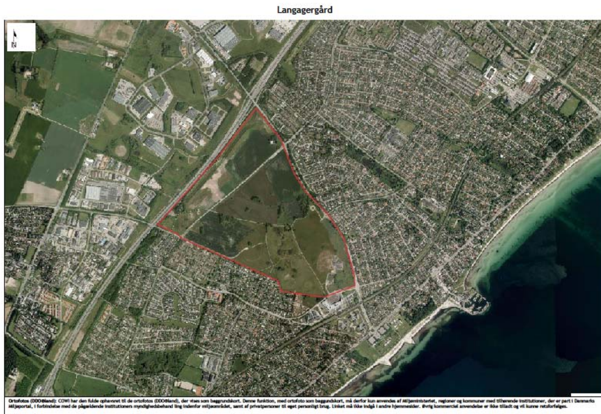
Figur 5: Området der skal undtages fra områdeklassificering (COWI, 2015).

Området ligger mellem Karlslunde Parkvej, Mosede Landevej og motorvejen. Området ligger i byzone og er udlagt til rekreative formål. Der har tidligere været brugt til jordbrug. Arealet udgør i alt 120 ha.