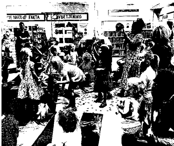
Familier til fortællekoncert i anledning af Karlslundes fødselsdag.

Da vi har erfaret at der regnes med fuldt gennemslag fra den 1.1.2023, vil vi henlede opmærksomheden på at der vil være opsigelsesvarsler på op til 6 måneder for en del af medarbejderne, samt at der også er en lang opsigelsesfrist på lejemålet hvor Karlslunde Bibliotek har til huse.