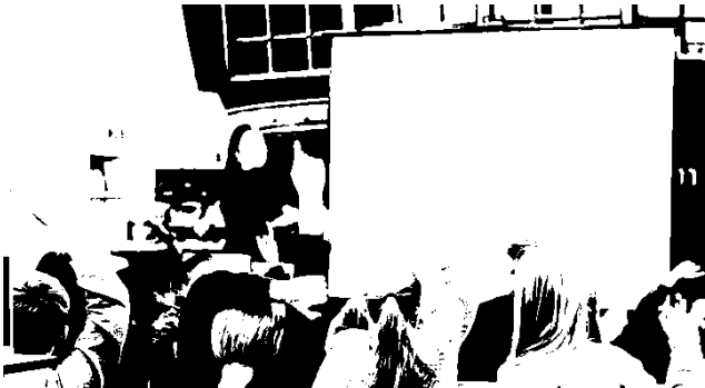
4. klasser til forfatterbesøg på biblioteket.

Ud over Karlslundes borgere vil Greves børn også blive ramt hårdt af de foreslåede besparelser. Biblioteket har et godt samarbejde med skolerne, og i biblioteksverdenen kigges der ofte til Greve, når man skal se på et succesfuldt samarbejde mellem skoler og bibliotek. Biblioteket bidrager til åben skole med de obligatoriske forløb for 3., 5. og 8 klasser samt flere andre frivillige forløb. Ud over de 60 årlige besøg fra 3., 5. og 8. årgang havde biblioteket sidste år 1 46 skolebesøg med i alt 1305 deltagende børn. Besøgene understøtter flere forskellige fag, og udvikler elevernes generelle dannelse og paratviden.