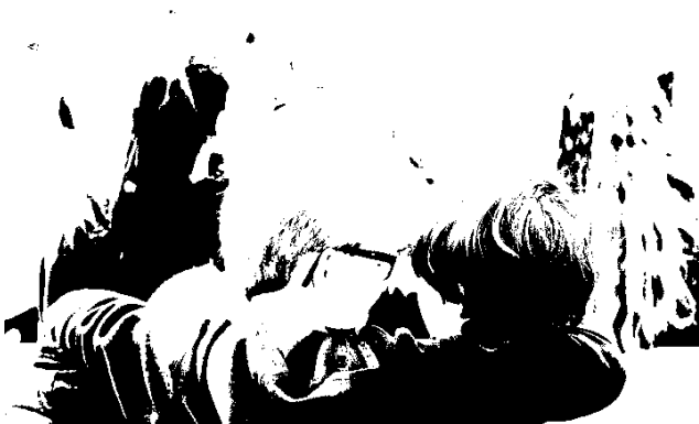
6. klasser til Smart Parat Svar – en landsdækkende konkurrence i paratviden.

Ud over skoleforløb havde Greve sidste år 59 forløb med daginstitutioner hvor 828 børn fra kommunens vuggestuer og børnehaver blev introduceret til litteratur. Ved at lave tidlig indsats for børnenes læselyst understøtter vi sprogstimulering og skaber glade læsere fra en tidlig alder. Undersøgelser viser at børn som læser klarer sig bedre i skolen og senere i arbejdslivet 2 .