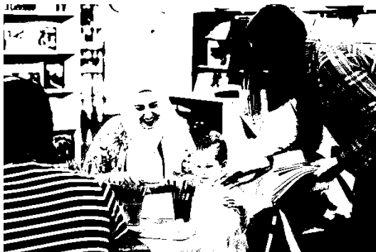
Pædagoger og børn til kreativ litteraturworkshop.

I Karlslunde Sogn bor der ca. 9.400 borgere, så det er over halvdelen der bruger deres lokale bibliotek.