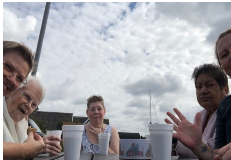
Svanehuset har både besøgt Mosedehavn og Hundige havn.