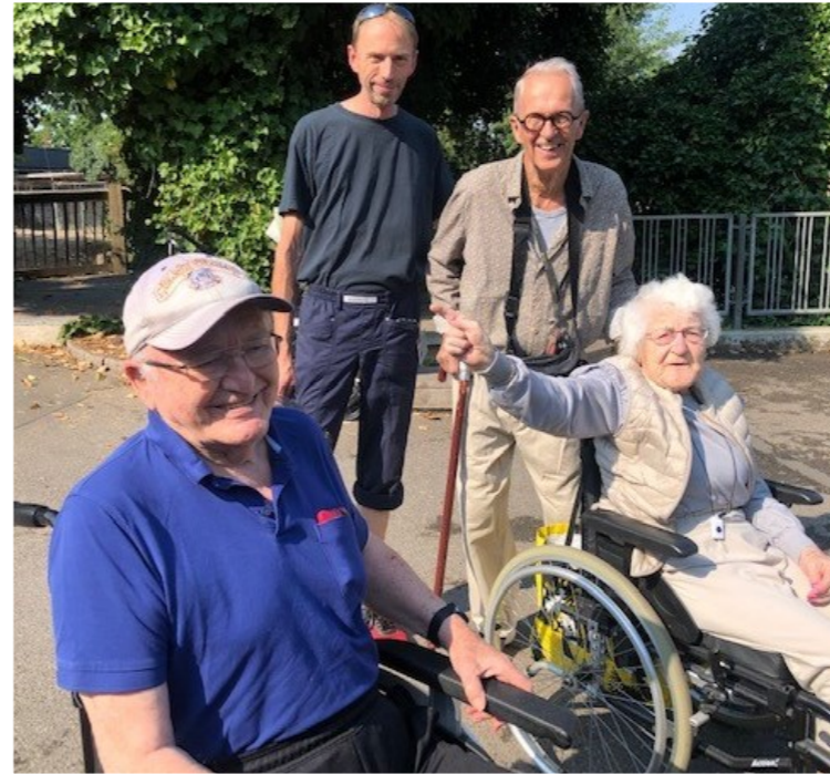
Tur til Zoo med Lærkehuset, Mosede havn og Trylleskoven med Vibehuset