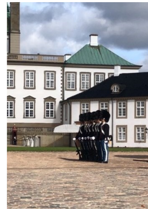
På udflugt til Fredensborg slot med Vibehuset, hvor vi var så heldige at se Gardere og vi vinkede til kronprinsesse Mary der kørte forbi os. Vi spiste vores hjemmebragte mad i bussen. På vej hjem fandt vi en vej-bod der solgte georginer, det kunne vi ikke stå for, så vi købte dem alle.