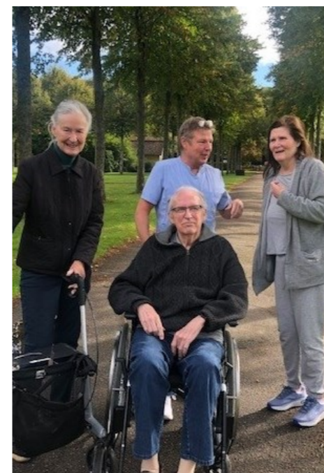
Lærkehuset & Svanehuset har været en tur på den Blå Planet, og Kvisten var en tur ved Vallø slot og gik en dejlig tur i slotsparken, herefter drak vi kaffe i bussen.