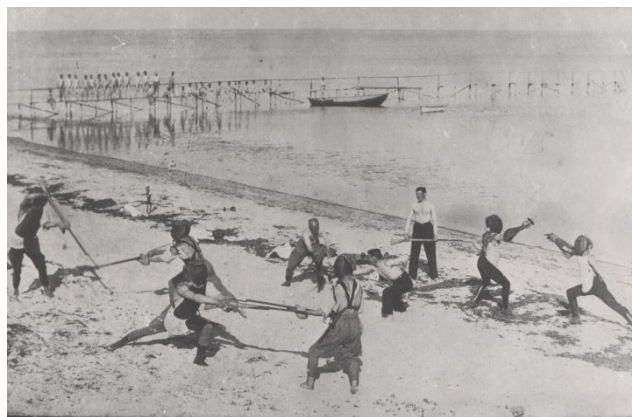
Soldaterne træner med bajonetter på stranden. Første Verdenskrig

fantastisk ramme for en fortættet fortælling om Danmarks særlige rolle under 1. verdenskrig. Herfra kan vi fortælle om, hvordan Danmark viste omverdenen viljen til at forsvare den neutrale status og suverænitæt. Men bygningen danner nu også ramme for fortællingen om, hvordan kampen for Danmarks og danskernes neutralitet var med til at skabe principperne for den velfærdsstat, hvor staten, erhvervslivet og befolkningen satte rammerne for Danmarks udvikling i resten af 1900-tallet og frem til i dag. Neutraliteten forudsatte et ydre forsvar med militære, handelsmæssige og diplomatiske tiltag samt en indre opbygning af velfærdsordninger for at sikre, at hele befolkningen stod bag den danske neutralitet og ikke blev en del af tidens revolutionære strømninger. Befolkningen, centrale personligheder og begivenheder var med til at skabe rammerne gennem bl.a. foreningsdanmark, der sad med ved statens forhandlingsbord, og deltog i udmøntning af alle de uddannelsesmæssige, sociale og sundhedsmæssige tiltag, som blev sikret den brede befolkning. Fortællingen udgør dermed i sig selv et centralt nationalt narrativ om skabelsen af den danske velfærdsmodel og det danske demokrati.