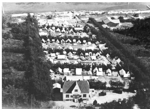
Teltlejren der siden blev til strandhusene. I forgrunden ses købmandsbutikken, der i dag er Jyske Bank.

Husene står der stadig i dag og mange af dem er ejet af efterkommerne af de første lejere.