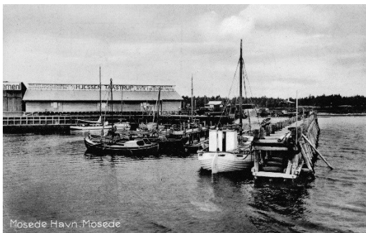
Mosedede Havn som den tog sig ud i 1932

En anden vigtig indkomstkilde for befolkningen langs stranden var fiskeriet. Siden oldtiden havde man fisket ud fra strandene med åbne både, der kunne hives på land. Men i slutningen af 1920'erne gik flere af fiskerne sammen for at