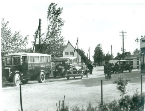
Før 1934 bestod strandvejen blot af nogle sandspor. Trafikken kunne være yderst farlig. Billedet er fra omkring badehotellet.

De første sommerhuse blev generelt bygget af den velhavende del af befolkningen, men i takt med, at ferie og weekender blev mere udbredt søgte også den brede arbejderklasse væk fra de små fugtige lejligheder i Københavns brokvarterer og ud mod luften og lyset ved strandene langs sydkysten. I 1919 holdt ca. 20 % af de organiserede arbejdere i Danmark ferie. I 1934 var tallet steget til 47 %. Det store boom kom dog først efter, at alle fik ret til to ugers ferie med løn som følge af Ferieloven i 1938.