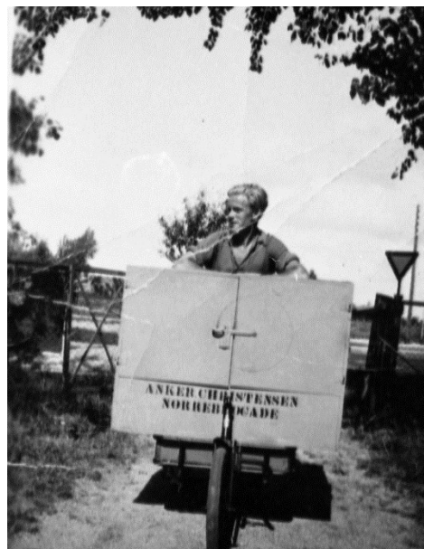
Brødet fra Frederiksberg bliver bragt til Hundige med budcykel ca. 1930'erne