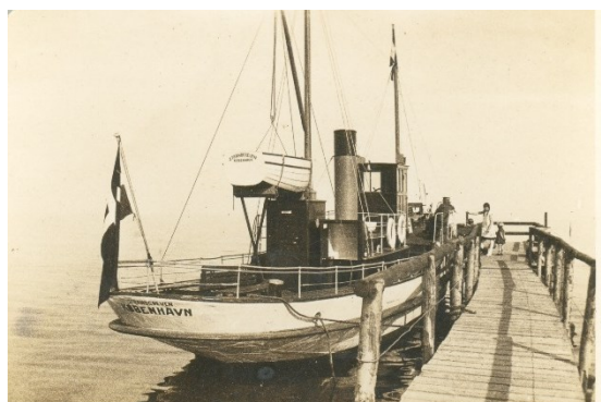
Strandgreven lægger til. Omkring 1930

Selvom havnen i 1969 blev kraftigt udvidet, kan man stadig se strukturen af den oprindelige havn. Flere af de bygninger, der pryder havnen i dag, for eksempel de to pakhuse på havnens sydside, og husene der i dag huser havnefogedkontoret er også oprindelige fra havnens spæde start.