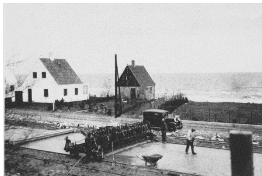
Etableringen af betonvejen i 1934, her er det omkring Karlslunde Strand.

Før etableringen af betonvejen kunne man ofte høre sætningen "Når cykelhjulet står fast i sandet, så er du nået til Greve". Før den nye betonvej, var der bare nogle sandspor og mange beretninger fortæller om, at det kunne være en både risikabel og langsommelig affære at tage en tur til stranden.