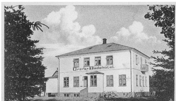
Greve Badehotel omkring opførelsen i 1926

Greve Strandkro, det tidligere Greve Badehotel, som blev opført i 1926, er et fysisk vidne fra tiden, hvor strandlivet var på sit højeste.