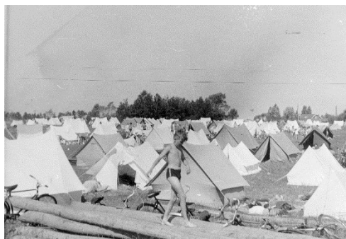
En dreng balancerer på bundgarnspæle foran Tomteli-lejren ved Mosede Strand. 1946

Teltlejre langs Køge Bugt blev mere og mere almindelige fra 1920'erne, og de følgende ti-år etablerede forskellige mere eller mindre organiserede befolkningsgrupper teltlejre. Arbejdspladser samt idræts- og fagforeninger lejede jordstykker, som deres ansatte og medlemmer frit kunne benytte. Vennekredse lavede aftaler med jordejere om benyttelse af et lille jordlod ved stranden og tilbragte ferier og weekender sammen her. Lokale fiskere oprettede lejre, hvor hvem som helst kunne leje sig ind og dermed få adgang til at opholde sig på stranden og bade i vandet.